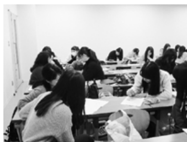
図4 グループワークの様子