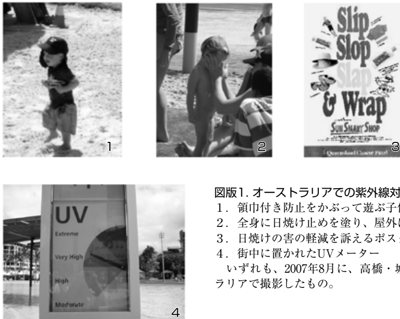
図版1. オーストラリアでの紫外線対策

紫外線による障害は、あえて地球環境問題と関連させずとも、日常生活でも有害レベルに達する曝露の起こりやすさは高く 3) 、また、日焼けによるシミや皮膚の老化に対する警戒感、特に若い女性に顕著である。しかし、リスクの認識の深浅には個人差があり、誤った理解に基づく、誤った対応も見られる。本研究は、紫外線に対する若い女性のリスク認識をアンケート調査により明らかにし、陥りやすい誤解を解くための、簡易な観測や実験を提案するものである。