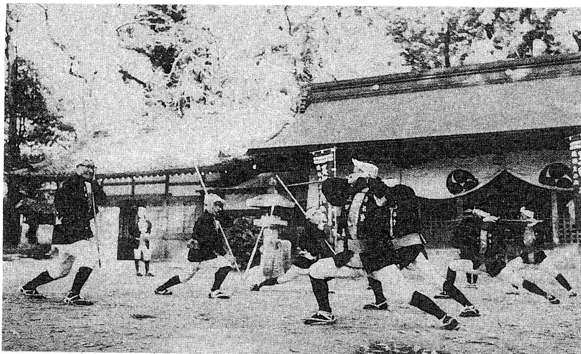
【図1】民俗芸能「棒の手」(愛知県足助町) (『愛知県ふるさとの伝統』より)

兼平は義仲とともに討ち死にしているので、この伝承は信じるわけにいかない。むしろ室町から戦国の時代に始まったという伝えのほうが正しいのだろう。戦乱の繰り返し返された時代に、農民の団結と武力を養う目的で取り入れられたものと推定されている。 注5)