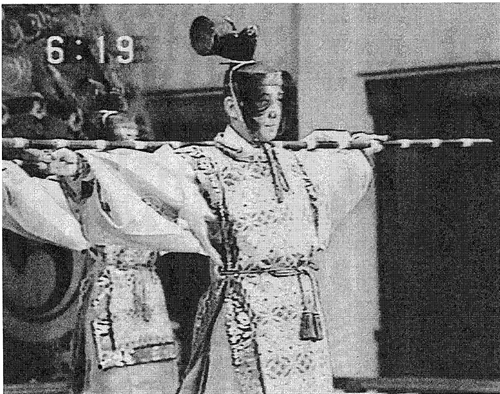
【図2】舞楽「狛棒」

まず何よりも、棒を持ってそれを操るという演技が、「棒縛」との共通点である。ただし、棒の形状に違いがある。「狛棒」の棒ははるかに長く、しかも等間隔に白い模様が付いていて竿状であるのに対し、「棒縛」の方は短くて、明らかに棒術の棒である。また、棒の使い方も異なるので、それが「狛棒」の影響であるとは考えに