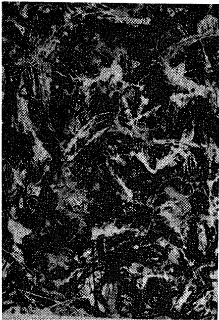
ジャクソン・ポロック