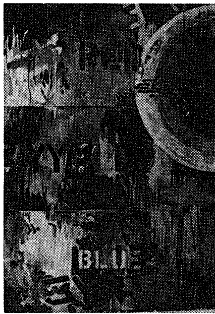
ジャスパー・ジョーンズ