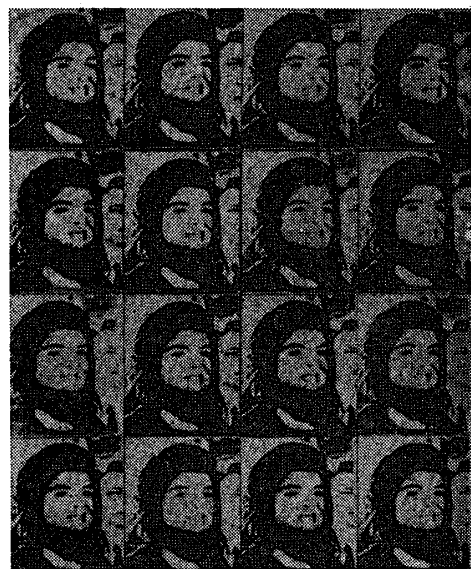
アンディー・ワーホール